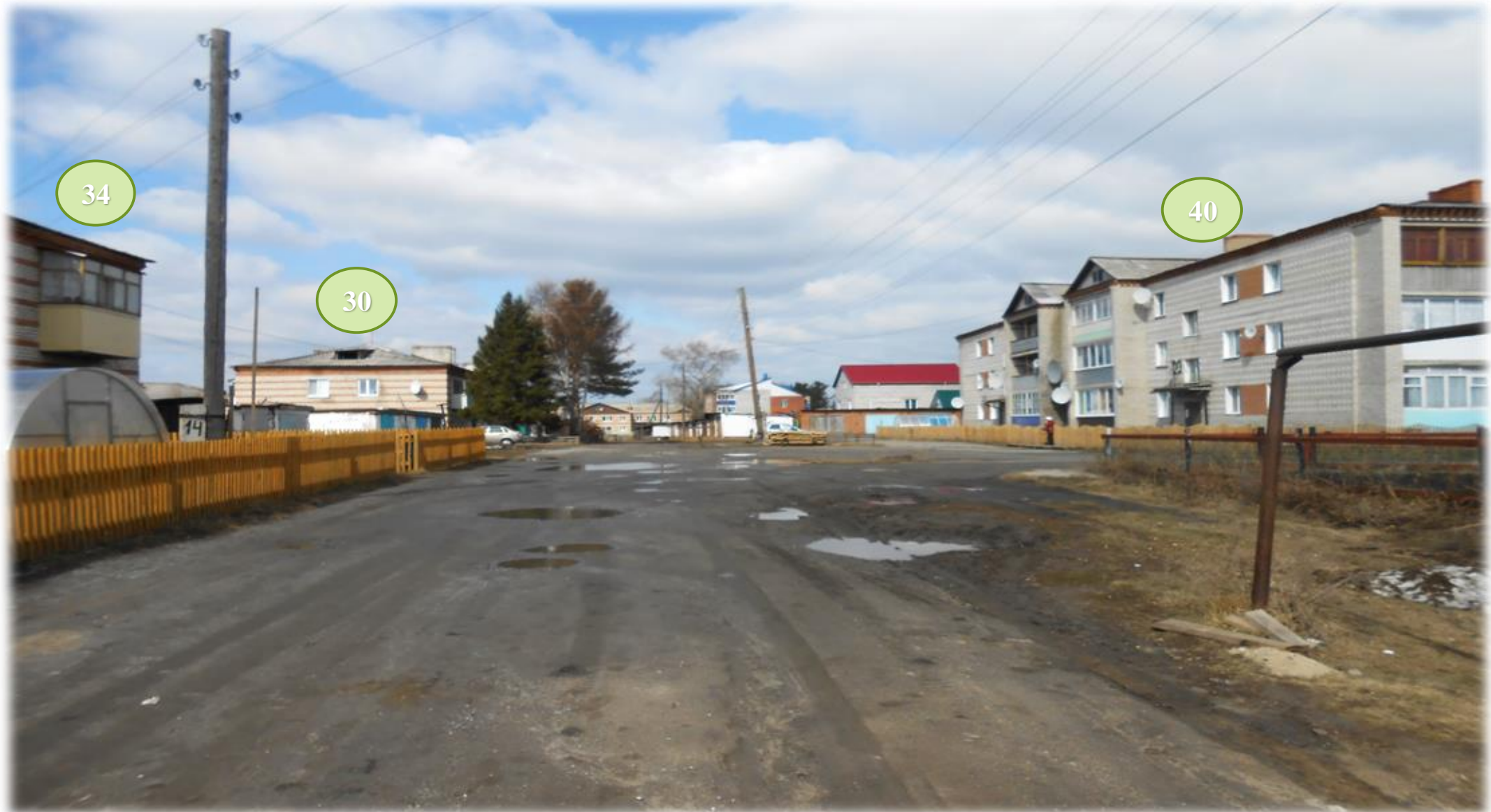
Рис.3. Дворовые территории МКД расположенных по адресу ул. Советская д.30, д.34, д.40